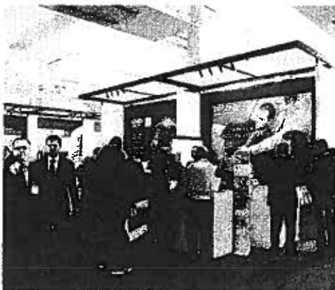
IL SALONE Tante le novità e le innovazioni tecnologiche che saranno presentate alla mostra, presso la Fiera del Levante

«Sono numerosi gli ambiti di innovazione delle imprese pugliesi "Lungimiranti" (12% in Puglia rispetto al 17% in Italia), che stanno utilizzando in modo "evoluto" sia l'infrastruttura ICT che il parco applicativo. - afferma Raffaello Balocco, Responsabile della Ricerca dell'Osservatorio Smau-School of Management - Alcune imprese stanno utilizzando in modo innovativo i servizi di fatturazione elettronica e dematerializzazione con notevoli benefici a livello di riduzione dei costi e di efficienza. Altre hanno puntato sulle applicazioni Mobile & Wireless, altre ancora hanno adottato sistemi gestionali integrati che hanno consentito una completa integrazione dei processi gestionale, con la possibilità di prendere decisioni migliori». I settori in media più "maturi" sono quelli della Chimica-Gomma-Plastica, del Metalmeccanico-Elettrico e dei Servizi finanziari